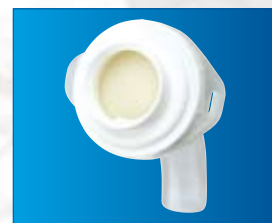
Avec CyAdaptor™ et filtre mousse