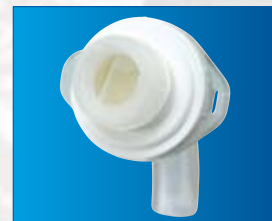
Avec valve automatique CyValveFreedom™